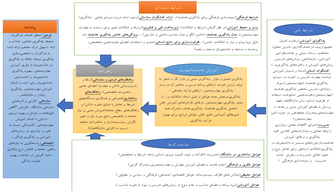
شکل (۱) مدل پارادایمی حاصل از کدگذاری محوری و انتخابی الگوی آموزش هدفمند (مهارت محور) در آموزش عالی ایران

در خصوص دستیابی و اکتشاف مقوله اصلی که محور شکل‌گیری مدل پارادایمی و ساماندهی سایر عناصر در ارتباط با آن است باید گفت محقق برای دستیابی به نظریه برخاسته از داده‌ها در خصوص ویژگی‌های واقعی پدیده اصلی یعنی طراحی الگوی آموزش هدفمند (مهارت محور) با مطلعین که تجارب ارزشمندی در ارتباط با موضوع مورد پژوهش داشتند مصاحبه کرده و تجارب و نگرش‌های آن‌ها را در این خصوص جویا شد. در نهایت مقوله‌ها در قالب ۲۱ مقوله اصلی در دل ابعاد ۶ گانه مدل پارادایمی به صورت موجبات علی (۳ مقوله)؛ پدیده اصلی (آموزش هدفمند)؛ راهبردها (۳ مقوله)؛ عوامل زمینه‌ای (۷ مقوله)؛ شرایط محیطی (۳ مقوله)؛ پیامدها (۳ مقوله) جای گرفتند که جزئیات آن را می‌توان در جدول (۱) یعنی کدگذاری داده‌ها شکل (۱) یعنی مدل پارادایمی مشاهده می‌گردد.