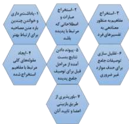
شکل ۱. راهبرد هفت مرحله‌ای کلایزی در تحلیل داده‌های کیفی

یکی از مهم‌ترین مسائل در پژوهش کیفی، اطمینان از صحت و ارزش درستی داده‌ها است که پژوهشگر در مطالعه حاضر برای تضمین اعتبار یا صحت یافته‌ها، سعی کرده است تا با اختصاص زمان کافی برای جمع‌آوری داده‌ها و استفاده از دو متخصص بیرونی جهت کنترل داده‌ها این اصل مهم را رعایت کند. همچنین اعتمادپذیری داده‌ها با روش پیشنهادی لینکلن و گوبا ۵ (۱۹۸۵) و از طریق بررسی همتایان و بازگرداندن توصیفات به افراد شرکت‌کننده و کسب تأیید آن‌ها بررسی گردید. پس از گردآوری داده‌ها، تحلیل‌ها به‌صورت مضامین اصلی و زیر مضمون‌ها به‌صورت گزاره نوشته شدند.