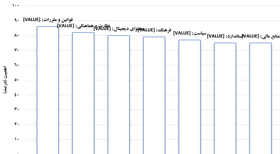
شکل ۳. اهمیت نسبی ابعاد آمادگی فناوری‌های نرم در یادگیری الکترونیکی بر اساس نظر خبرگان