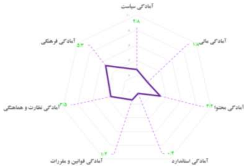
شکل ۴. نمودار راداری آمادگی ابعاد فناوری نرم در دانشگاه‌های منتخب کشور برای تحقق یادگیری الکترونیکی

همچنین میانگین امتیاز کسب‌شده برای هر یک از ابعاد آمادگی نرم دانشگاه‌ها نیز به صورت نمودار راداری در شکل ۴ قابل مشاهده است. این نتایج حاکی از آن است که میانگین امتیاز دانشگاه‌ها 2/6 از 10 و نشان‌دهنده سطح «ضعیف» آمادگی ابعاد فناوری نرم دانشگاه‌ها در زمینه یادگیری الکترونیکی است.