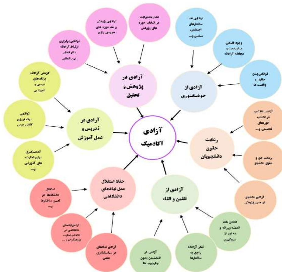
نمودار ۱: شبکه مضامین آزادی آکادمیک از دیدگاه اعضای هیئت علمی