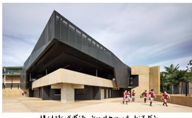
شکل ۲: نمای از سردر فضای ورزشی، دانشگاه کوئینزلند استرالیا

همان‌طوری که در شکل ۲ مشاهده می‌شود، ورودی فضای ورزشی دانشگاه، از جلوه بصری معماری و خلاقانه‌ای برخوردار است و شکل ۳ نشانگر وجود فضاهای ورزشی در مجاورت سایر فضاهای دانشگاه همچنین در مجاورت جاذبه‌های طبیعی و محیطی (رودخانه و فضاهای سبز) می‌باشد.