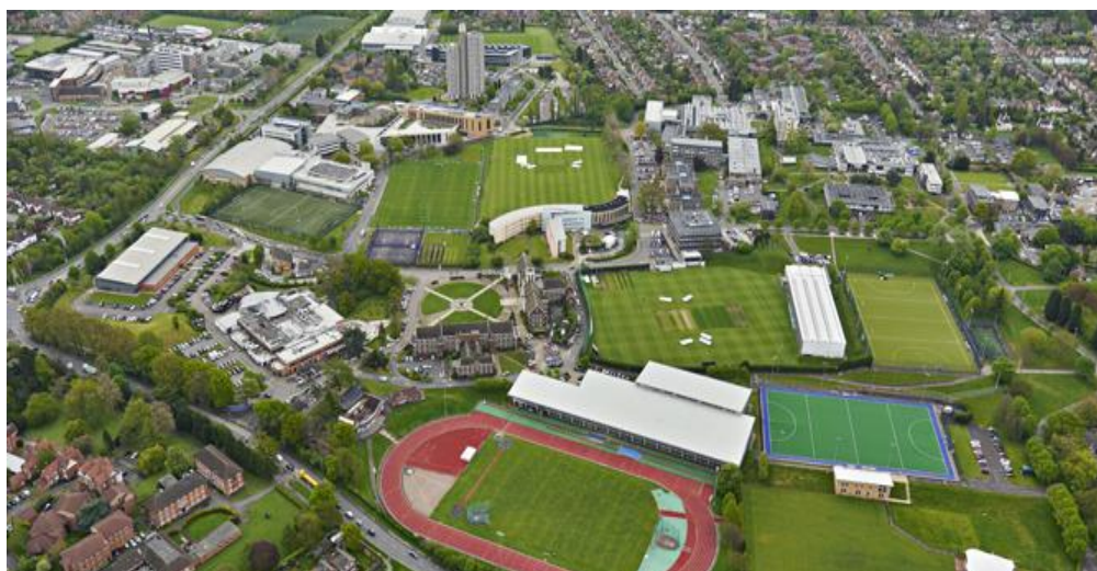
شکل ۱: نمای هوایی از فضاهای ورزشی دانشگاه لوبورو انگلستان

دانشگاه لوبورو دارای بیش از ۱۶ زمین ورزشی برای ورزش‌های مختلف مانند زمین هاکی، زمین فوتبال،