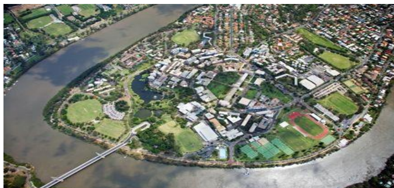
شکل ۳: نقشه هوایی دانشگاه کوئینزلند استرالیا

همان‌طوری که در شکل ۲ مشاهده می‌شود، ورودی فضای ورزشی دانشگاه، از جلوه بصری معماری و خلاقانه‌ای برخوردار است و شکل ۳ نشانگر وجود فضاهای ورزشی در مجاورت سایر فضاهای دانشگاه همچنین در مجاورت جاذبه‌های طبیعی و محیطی (رودخانه و فضاهای سبز) می‌باشد.