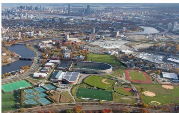
شکل ۱۴: نمای هوایی از دانشگاه هاروارد