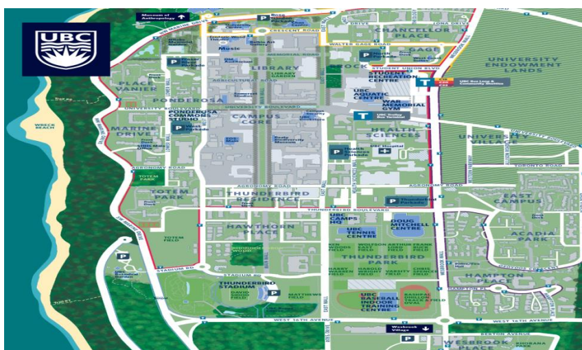
شکل ۵: نقشه هوایی دانشگاه بریتیش کلمبیا