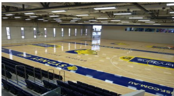
شکل ۹: زمین بسکتبال دانشگاه سیدنی استرالیا