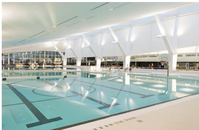
شکل ۶: نقشه استخر دانشگاه بریتیش کلمبیا