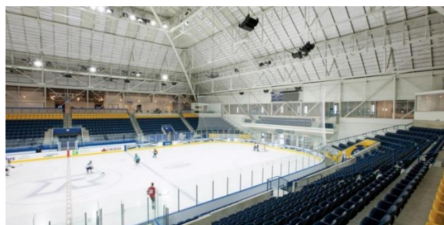
شکل ۱۲: زمین هاکی روی یخ

تصاویر فوق نشان می‌دهند که دانشگاه با امکانات در حد برگزاری مسابقات بین‌المللی به دانشجویان ارائه خدمات ورزشی می‌کند و شرایط اقلیمی و محیطی به‌خوبی در آن فضاها لحاظ شده است.