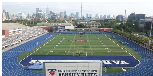
شکل ۱۱: نمای هوایی از استادیوم