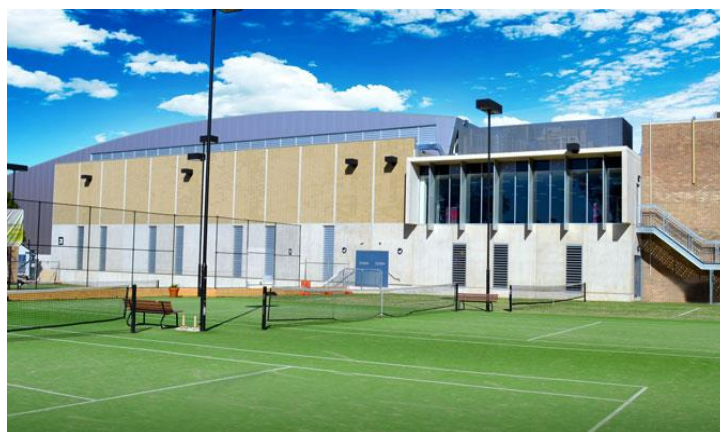
شکل ۸: فضای ورزشی دانشگاه سیدنی استرالیا