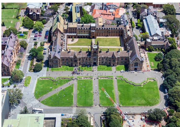
شکل ۷: نمای هوایی دانشگاه سیدنی استرالیا

بیش از ۱۶۰ سال از تأسیس دانشگاه می‌گذرد و ارزش‌های موردنظر خود را «شجاعت و خلاقیت، احترام، برخورد باز و تعهد» می‌داند. با این مسئولیت که همواره سنت‌ها را به چالش بکشد و رهبران آینده را تربیت کند.