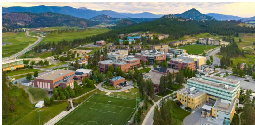
شکل ۴: عکس هوایی دانشگاه بریتیش کلمبیا