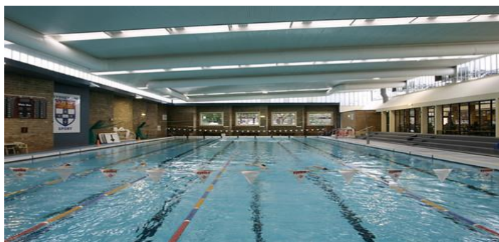
شکل ۱۰: استخر دانشگاه سیدنی استرالیا