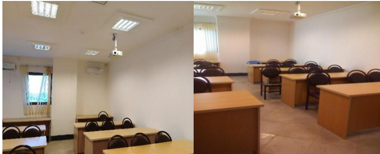
عکس های شماره ۵ و ۶

که در لایه زیرین آن الیافی برای نرمی نشیمن گاه و تکیه گاه قرار داده شده است. ارتفاع این صندلی از میز استقرار استاد کمتر است و لذا در کنار آن قرار داده شده است. این دو عکس نماینده ای از کلاس های مقطع کارشناسی دانشگاه هستند.