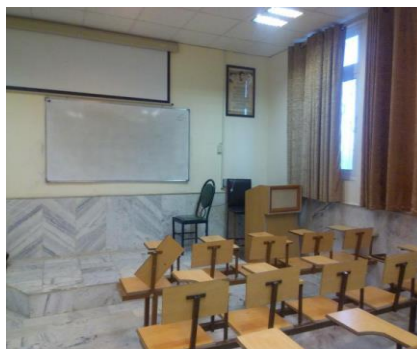
عکس شماره ۴

عکس ۳ چند صندلی با ویژگی‌های طرح‌شده برای صندلی‌های عکس ۱ را نشان می‌دهد، آلا اینکه این صندلی‌ها انفرادی، مستقل و با فاصله از هم هستند، ولی اگرچه قابل جابجایی هستند و در زمین ثابت نشده‌اند، کاملاً در جوار یکدیگر قرار گرفته‌اند. وضعیت پنجره، پرده و نور کلاس مشابه عکس ۱ است.