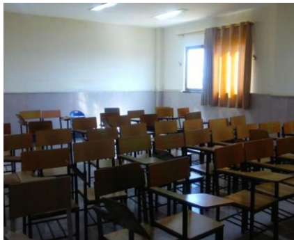
عکس شماره ۳

عکس ۳ چند صندلی با ویژگی‌های طرح‌شده برای صندلی‌های عکس ۱ را نشان می‌دهد، آلا اینکه این صندلی‌ها انفرادی، مستقل و با فاصله از هم هستند، ولی اگرچه قابل جابجایی هستند و در زمین ثابت نشده‌اند، کاملاً در جوار یکدیگر قرار گرفته‌اند. وضعیت پنجره، پرده و نور کلاس مشابه عکس ۱ است.