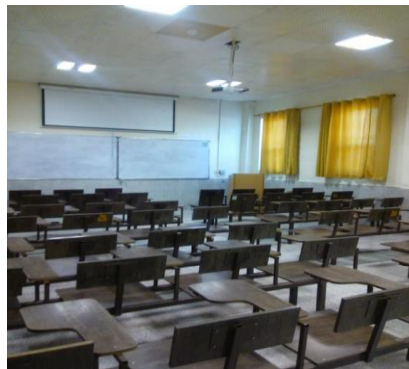
عکس شماره ۲

عناصر ساختاری نظام نشانه‌ای غیرکلامی عکس ۱ عبارتند از صندلی‌ها با پایه فلزی و بدنه چوبی (نشیمن‌گاه، پشتی و دسته چوبی تاشو) که در دو طرف کلاس چیده شده‌اند و تنها به اندازه عبور یک نفر میان آنها چه در سطر و چه در ستون فاصله است. صندلی‌های هر ردیف در هر طرف به یکدیگر متصل هستند و در کف کلاس ثابت شده‌اند؛ ضمن اینکه روی صندلی‌های به یک طرف (میز سخنرانی مدرس، تخته سفید و پرده نمایش فراتاب ) است. پشتی صندلی‌ها نسبت به نشیمن‌گاه زاویه‌ای قائمه دارد. ثلث پایینی دیوارهای کلاس از سنگ سفید مرمر و باقی آن تا سقف، گچ و کرم رنگ است. کف کلاس از سنگ گرانیت است. پنجره‌ها مستطیلی و از جنس آلومینیوم هستند که بر روی آنها یک پرده قطور به رنگ قهوه‌ای و از جنس مخمل آویزان است. برای مدیریت نور این پرده‌ها تنها یک گزینه وجود دارد و آن کشیدن سرتاسری پرده است.