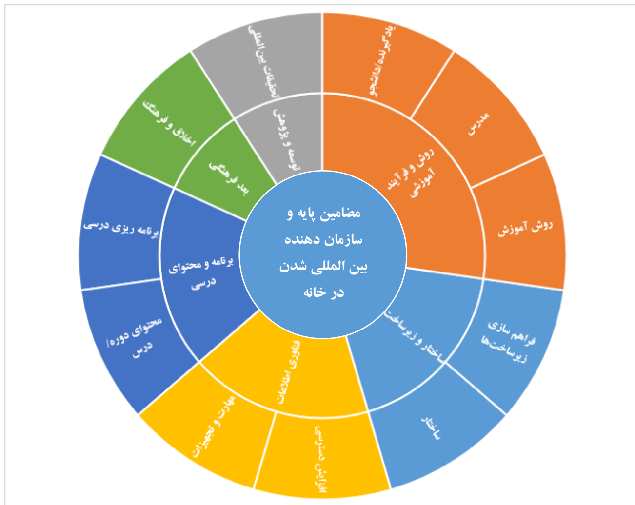
شکل شماره ۳- مضامین پایه و سازمان دهنده بین‌المللی شدن در خانه برای دانشگاه‌های تخصصی

تخصصی عبارت‌اند از: برنامه و محتوای درسی، روش و فرآیند آموزشی، توسعه و پژوهش، فناوری اطلاعات، ساختار و زیرساخت و بعد فرهنگی.