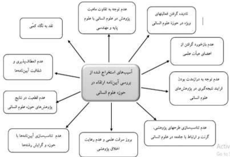
شکل ۱: آسیب‌های موجود آیین‌نامه ارتقاء در حوزه علوم انسانی

بر مبنای کدهای محوری و انتخابی موجود در جداول ۳ و ۴، الگوهای مرتبط با آسیب‌شناسی و اصلاح آیین‌نامه ارتقاء در حوزه علوم انسانی در شکل‌های ۱ و ۲ مشاهده می‌شود. شکل ۱ الگوی استخراج‌شده از آسیب‌های شناسایی‌شده در آیین‌نامه ارتقای اعضای هیئت‌علمی را بر اساس دیدگاه مشارکت‌کنندگان نشان می‌دهد.