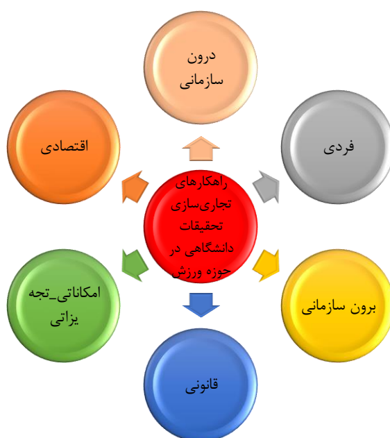
شکل ۱. مدل نهایی راهکارهای تجاری‌سازی تحقیقات دانشگاهی در حوزه ورزش

پس از تحلیل داده‌های به دست آمده از مصاحبه‌ها راهکارهای تجاری‌سازی تحقیقات در حوزه ورزش استخراج شد. در بخش مفاهیم ۵۷ کد به دست آمد که از کدگذاری این بخش ۱۰ مقوله شامل آموزشی-پژوهشی، منابع انسانی، مدیریتی، بازاریابی، شخصیتی، ارتباطی، سیاست‌گذاری، حقوقی-نظارتی، سخت‌افزاری- نرم‌افزاری، اقتصادی به دست آمد. در ادامه از کدگذاری مقوله‌ها، ابعاد به دست آمد که شامل ۶ بعد درون‌سازمانی، فردی، برون‌سازمانی، قانونی، امکانات-تجهیزاتی، اقتصادی بود که در نهایت به مدل نهایی ختم شد که در شکل ۱ ملاحظه می‌شود.