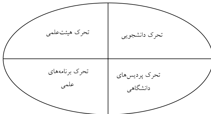
شکل ۱- الگوی جامع تحرک علمی دانشگاهی

آمارهای یونسکو نشان می‌دهد تعداد دانشجویان متقاضی تحصیل در خارج از یک میلیون و ۳۰۰ هزار نفر در سال ۱۹۹۰ به ۴ میلیون و ۳۰۰ هزار نفر در سال ۲۰۱۱ رسیده است. بر اساس همین آمارها تعداد دانشجویان بین‌المللی در سال‌های ۲۰۰۲، ۲۰۰۹ و ۲۰۱۴ به ترتیب حدود ۲/۱، ۳/۷ و ۵ میلیون نفر بوده است. همچنین، بر اساس پیش‌بینی یونسکو تعداد دانشجویان بین‌المللی در سال ۲۰۲۵ به مرز ۸ میلیون نفر می‌رسد (UNESCO, 2013). بر اساس همین برآوردها حدود ۲ درصد کل دانشجویان جهان به صورت شناور در حال تحصیل هستند. در این میان، کشورهای اروپایی حدود ۴۶ درصد کل جمعیت دانشجویی شناور خارج‌شده از اروپا را تشکیل می‌کنند. با این حال، دانشجویان کشورهای اروپایی حدود ۲۴ درصد کل جمعیت دانشجویی شناور خارج‌شده از اروپا را تشکیل می‌دهند. دانشجویان کشورهای آسیایی ۵۰ درصد کل دانشجویان در حال تحصیل در خارج را تشکیل می‌دهند. ایالات متحده مقصد حدود ۲۷ درصد دانشجویان بین‌المللی است و حدود ۳۰ درصد کل مدارک دکتری جهان در این کشور اعطاشده است (National Science Board, 2010). این میزان، بخشی از گسترش معنی‌دار تعداد دانشجویان شاغل به تحصیل در خارج در دهه نخست قرن ۲۱ است. بسیاری از صاحب‌نظران بر این عقیده‌اند که علاقه به برنامه‌های تحصیل در خارج دارای روند افزایشی خواهد بود. بر اساس آمارهای سازمان امور دانشجویان، در نظام آموزش عالی پرقدرت ایران ۲۱ هزار دانشجوی خارجی شامل ۵۰ درصد در علوم انسانی، ۳۰ درصد در علوم فنی- مهندسی، ۱۷ درصد در علوم پزشکی