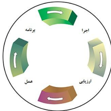
شکل ۱: چرخه بهبود بهره‌وری

از سوی دیگر، محدودیت منابع، سرعت و کیفیت ارائه خدمات، تشدید رقابت و ضرورت انجام هدفمند امور، زمینه توجه به عملکرد دانشگاه‌ها را فراهم کرده است. یکی از راه‌های ارزیابی عملکرد، ارزیابی و سنجش کارایی است. اندازه‌گیری کارایی و شناسایی عوامل مؤثر بر آن، بخشی از مدیریت چرخه بهبود بهره‌وری به حساب می‌آید. به‌منظور برنامه‌ریزی صحیح و عملی برای رسیدن به این هدف، احتیاج مستمر به اندازه‌گیری کارایی و همچنین بررسی عوامل مؤثر بر آن در دوره‌های مختلف دانشگاه‌هاست.