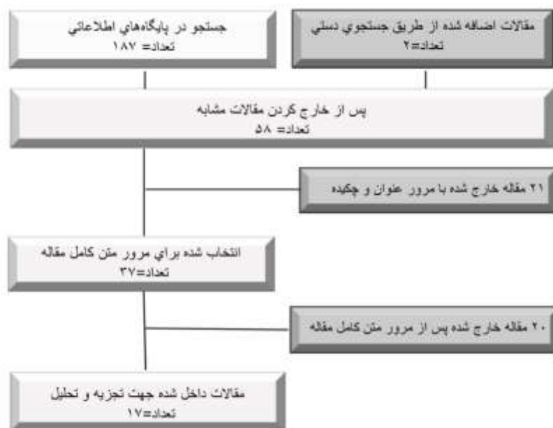
شکل ۱. چارت انتخاب مقالات

بر اساس استراتژی جستجو ۱۸۹ مقاله به دست آمد که به طور نظام‌مند از نظر مرتبط بودن بر اساس عناوین و چکیده‌ها بررسی شدند. در پایگاه‌های داخلی مقاله‌ای که به سؤال پژوهش پرداخته باشد، یافت نشد. فقط مطالعاتی که معیارهای ورود و خروج را داشتند حفظ شدند. علاوه بر این، برای اطمینان از اینکه مطالعات دارای دقت روش‌شناختی کافی هستند، تنها مطالعاتی که در مجلات معتبر منتشر شده بودند در نظر گرفته شدند. غربال‌گری مقالات در دو مرحله انجام شد. ابتدا در پایگاه‌های اطلاعاتی مذکور مقالاتی که به زبان غیر انگلیسی بودند، مقالاتی که قبل از سال ۲۰۰۰ منتشر شده بودند و مطالعاتی که مقاله علمی - پژوهشی نبودند، از لیست خارج شدند. در مرحله دوم غربال‌گری پس از حذف موارد تکراری، ابتدا عنوان و چکیده مقالات با دقت مطالعه و مقالات غیر مرتبط حذف شدند، ۳۷ مقاله برای بررسی متن کامل باقی ماند. در مرحله نهایی پالایش، مقالاتی که به مباحثی غیر از ویژگی‌های دانشجویی ایده آل پرداخته بودند و همسو با هدف این پژوهش نبودند از مطالعه خارج شدند و ۱۷ مقاله تمام متن برای تحلیل نهایی شناسایی شد.