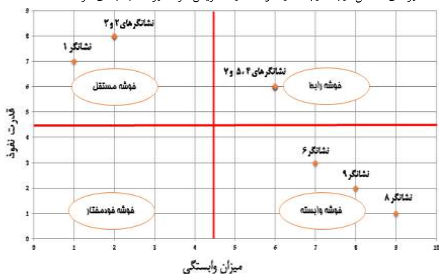
شکل ۲. تجزیه و تحلیل قدرت نفوذ و وابستگی نشانگرهای کزرفتاری های دانشگاهی با روش MICMAC

این گام از تجزیه و تحلیل باهدف تعیین قدرت نفوذ و میزان وابستگی نشانگرهای شناسایی انجام شده است؛ چراکه پس از تعیین قدرت نفوذ یا اثرگذاری و میزان وابستگی یا اثرپذیری نشانگرها می‌توان تمامی نشانگرهای مؤثر بر کزرفتاری های دانشگاهی را در یکی از خوشه‌های چهارگانه (متغیرهای مستقل، رابط، وابسته و خودمختار) ماتریس اثر متغیرها طبقه‌بندی کرد.