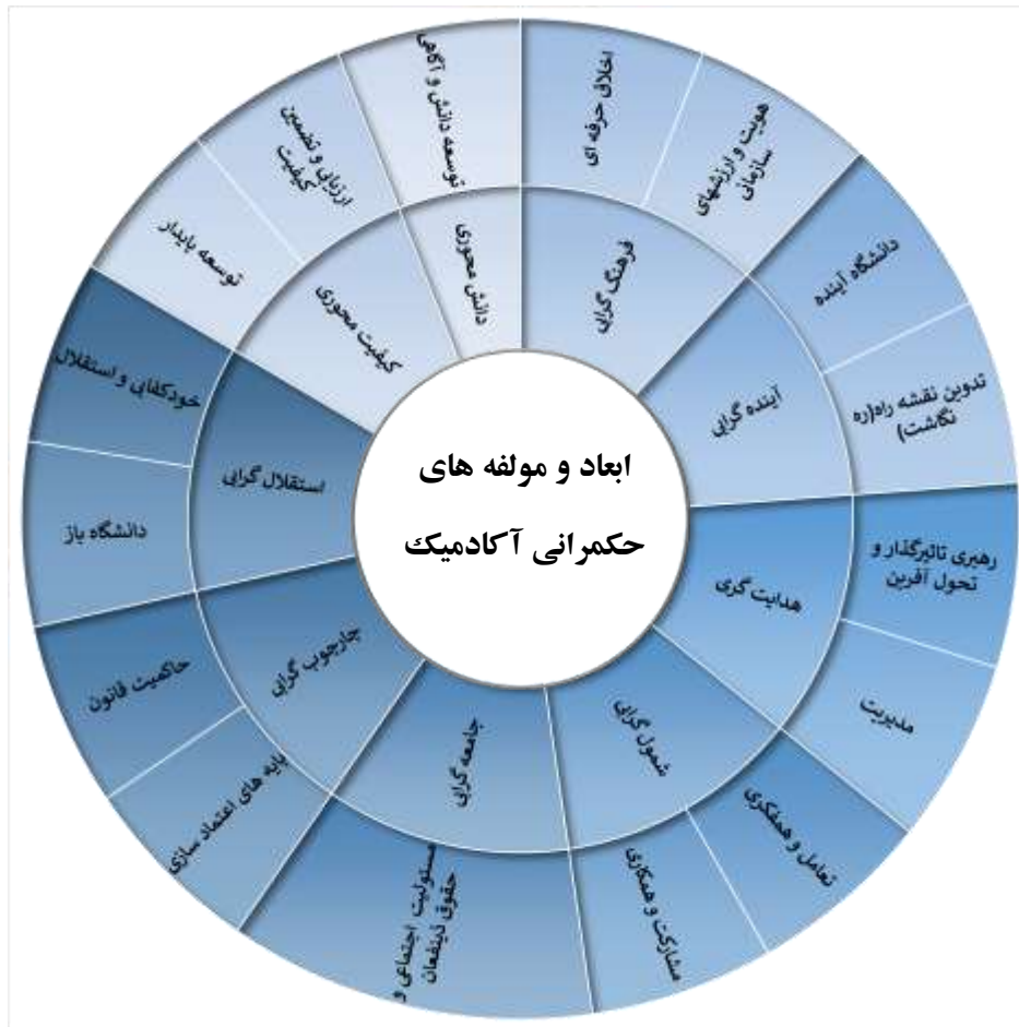
شکل ۲- مدل مفهومی حکمرانی آکادمیک (حاصل فراترکیب)

در این مدل ابعاد حکمرانی آکادمیک عبارت‌اند از: استقلال‌گرایی، چارچوب‌گرایی، جامعه‌گرایی، شمول‌گرایی، هدایت‌گری، آینده‌گرایی، فرهنگ‌گرایی، کیفیت‌محوری و دانش‌محوری.