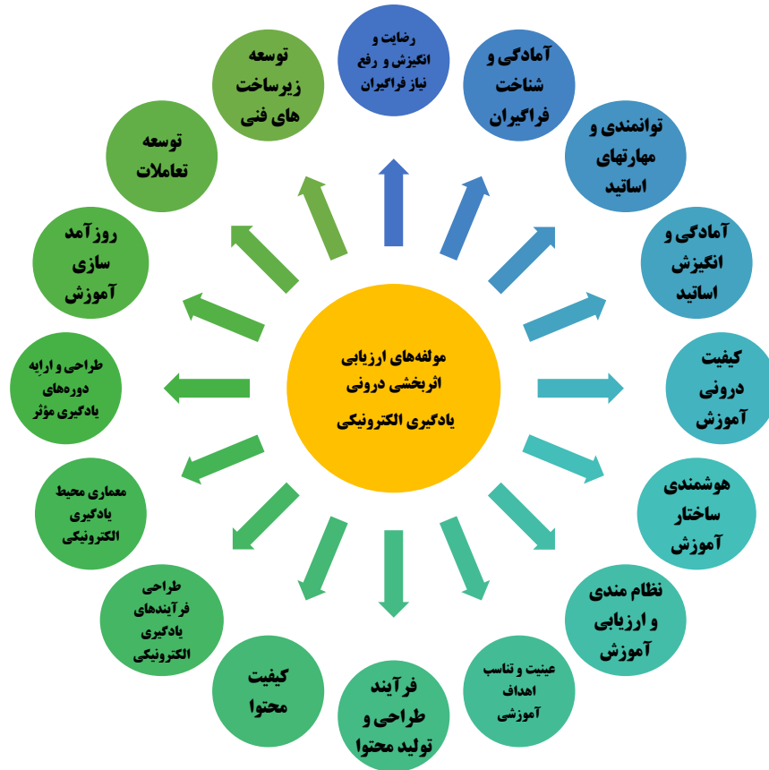
شکل ۱. شبکه مضامین مؤلفه‌های ارزیابی اثربخشی یادگیری الکترونیکی